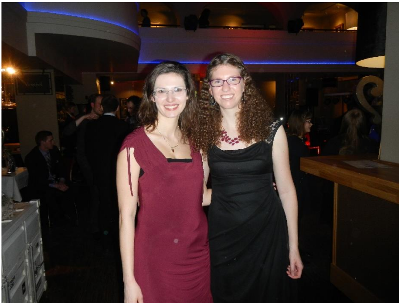
16 Winterball – A téli szemeszter záróünnepélye