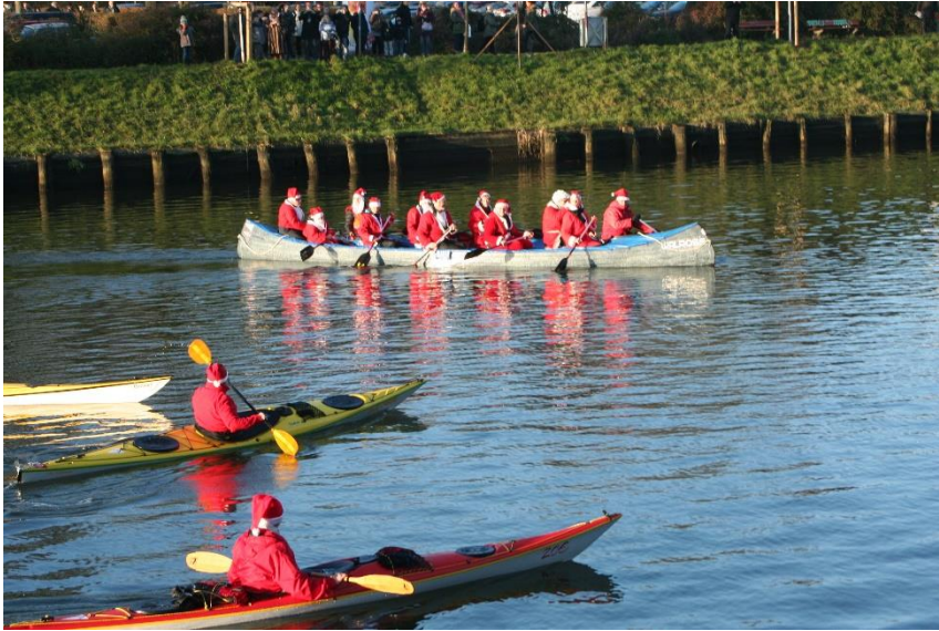
11 Ahol a Mikulások is csónakkal jönnek