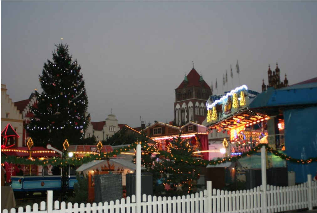
15 Karácsonyra készülve