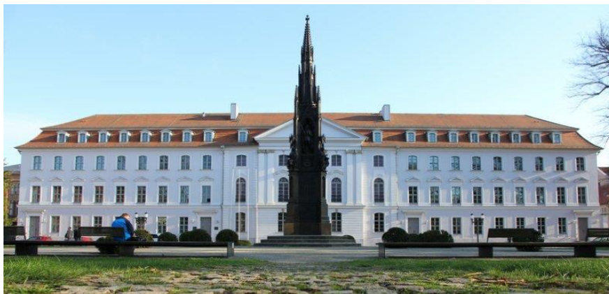
3 Ernst-Moritz-Arndt Universitát Greifswald

Mire az egyetem októberben elkezdődött, már egy kéthetes intenzív nyelvkurzuson voltunk túl. Ezen a tanfolyamon elsősorban olyan nyelvtani szerkezeteket és kifejezéseket gyakoroltunk, amelyekkel akadémiai szövegekben gyakran lehet találkozni. Ellentétben a hazai oktatással, Németországban téli és nyári szemeszterek vannak. Ez azt jelenti, hogy október közepétől januárig tart az első félév, február és március vizsgaidőszak, illetve tanítási szünet; áprilistól júliusig van a nyári szemeszter, illetve augusztus, szeptember ugyancsak vizsgaidőszak, nyári szünet.