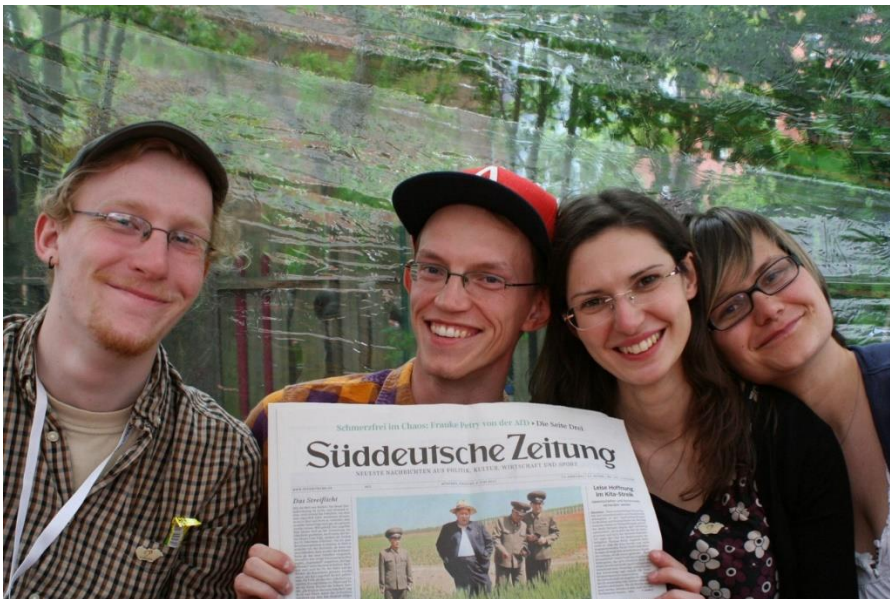
14 A "Süddeutsche Zeitung" örök barátunk maradt a kávé mellett