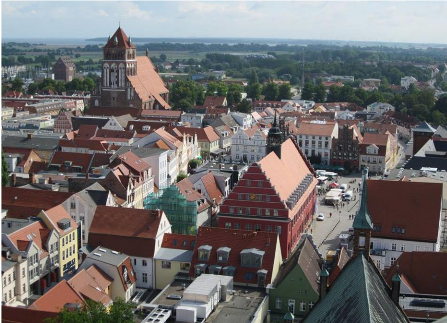
5 Greifswald madártávlatból

Hadd álljon itt még néhány kép az erasmusos élményekről!