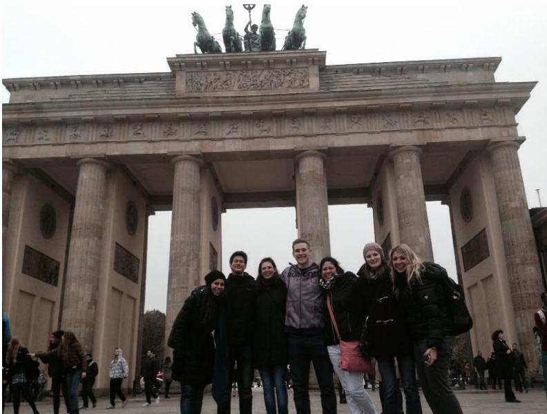
6 Utazás Berlinbe