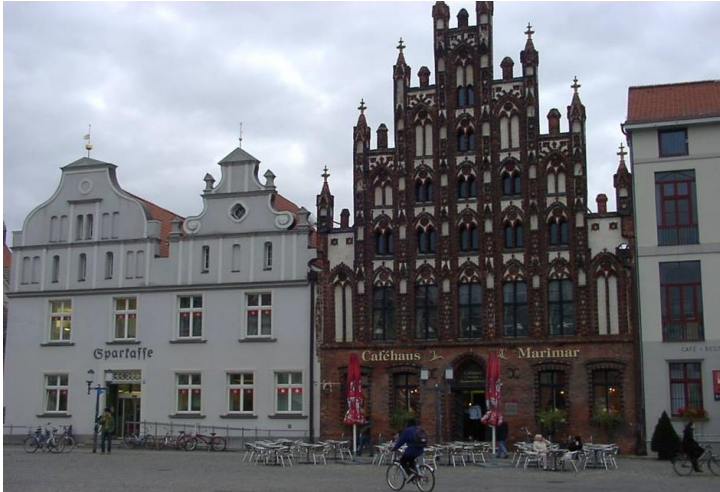
7 Greifswald, Marktplatz