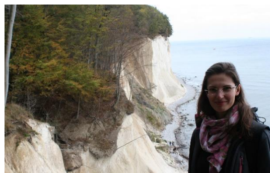
4 Rügen, Németország legnagyobb és egyik legszebb szigete

Míndeközben a nemzetközi iroda és az Erasmus csapat számos, jobbnál jobb programot kínált a külföldről érkező diákok számára. Kéthetente keddenként volt a „Stammtisch”, ahol beszélgetéssel, kvizzel, játékokkal töltöttük közösen az estét „törzshelyünkön”. Az International Office utazásokat szervezett, ami szintén felejthetetlen marad. Hosszú hétvégeken elmentünk Berlinbe, Hamburgba, és Rostockba, Lübeckbe, ahol általában találkoztunk más erasmusos diákokkal is. Egynapos kirándulásokat szerveztek a közeli Starlsund városába, ami az UNESCO világörökség része, és itt az óceánium különleges betekintést nyújt a tenger életébe. Megcsodálhattuk a gyönyörű szigetvilág, Rügen krétaszigetét, ahogy a tenger mellett magasra emelkednek a fehér sziklafalak, és az ösvény hol lent a tengerparton, hol fent a sűrű erdőben vezet.