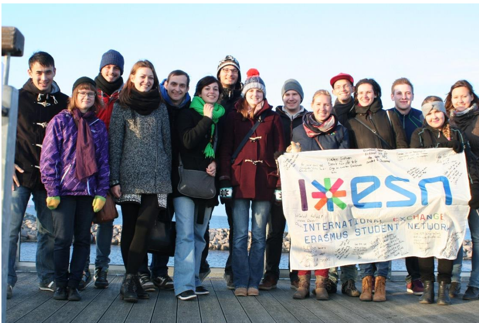
10 Warnemünde, kirándulás Rostockba erasmusos program keretében