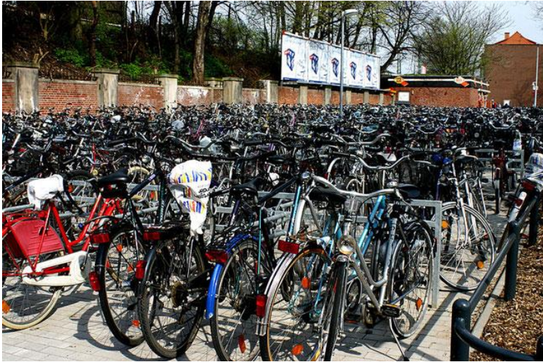
9 Biciklik sokasága a menza előtt