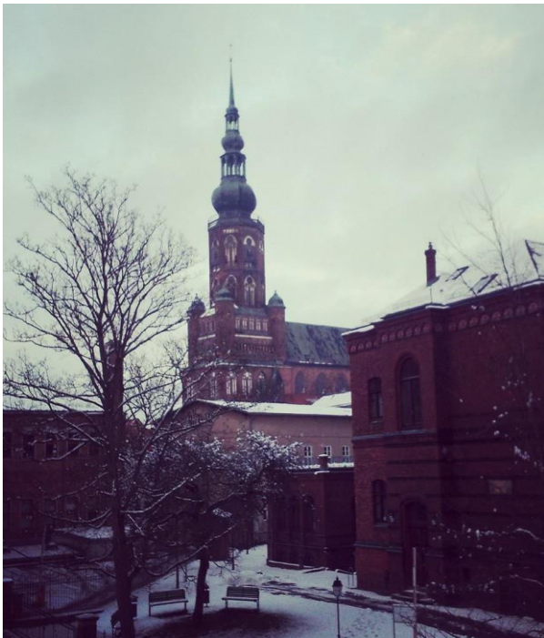
8 St. Nikolai Dom, Greifswald