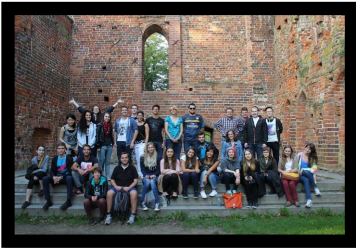
2 Erasmusos diákok Eldenán, Greifswald

A Greifswaldi Ernst-Moritz-Arndt Universitát szeptember első heteiben ún. „Erstiwoche”