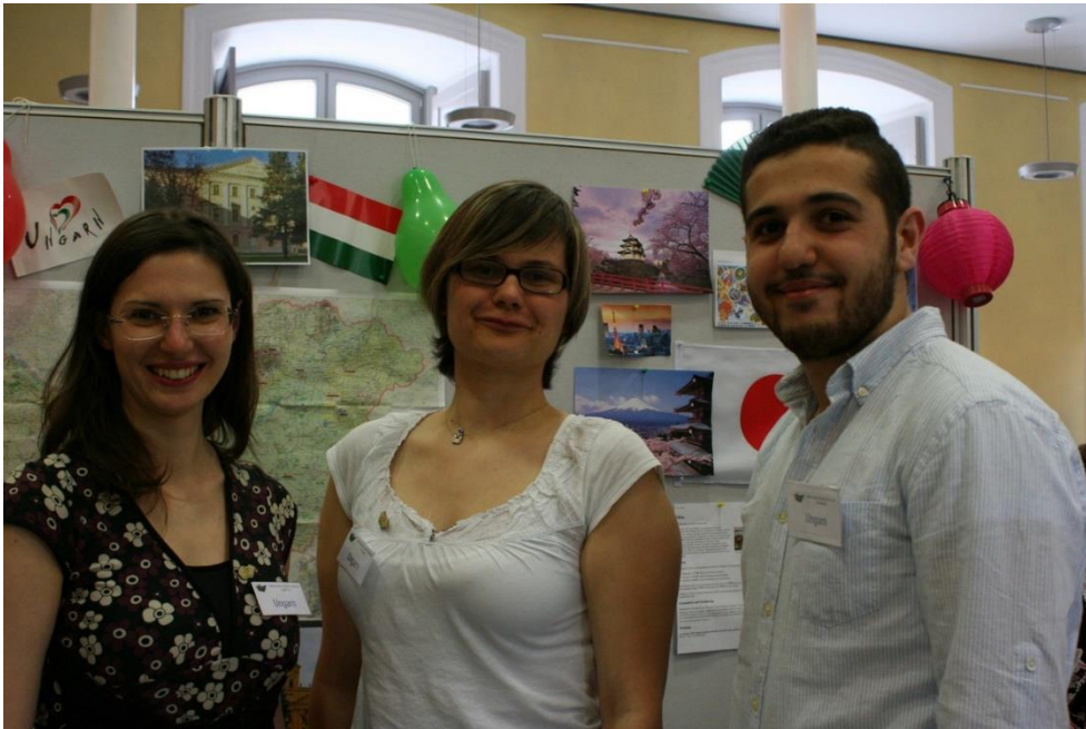
12 Expo: Internationaler Tag an der Universität